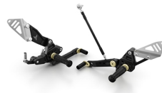
Sada pro seřízení pedálů Billet pro model MT-07