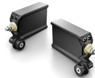
Napínač řetězu Billet pro model MT-07