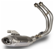
Plnohodnotný systém s titanovým tlumičem výfuku pro model MT-07